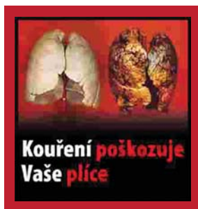
Obrázek 1. Příklad varování

Nejúčinnější prevencí jsou zákony, které nejenže stát nic nestojí, dokonce by na nich vydělal. Jsou to především vysoké daně a tím daná vysoká cena cigaret, dále zcela nekuřácké všechny uzavřené veřejné prostory včetně restaurací, naprostý zákaz jakékoli reklamy a marketingu tabákových výrobků včetně místa prodeje, cigarety by dokonce ani v trafice neměly být vidět, ale být zavřené v neprůhledné skříňce, kuřák si jen řekne, co chce. Samozřejmostí by měl být prodej jen ve specializovaném obchodě s licencí, tedy v trafice, a ne dohromady například s potravinami. Na krabičkách by měla být zdravotní varování s obrázkem, a to na více než 50 % plochy. Příklad našeho varování, které se týká dýchacích cest, je na obrázku 1.